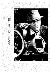
井上梅次 創る心 978-4-86677-122-9