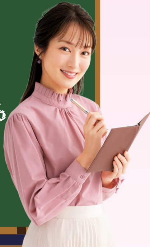
ろうきんイメージモデル 高梨臨