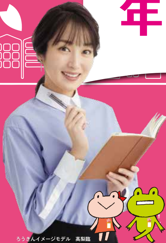
ろうきんイメージモデル 高梨臨