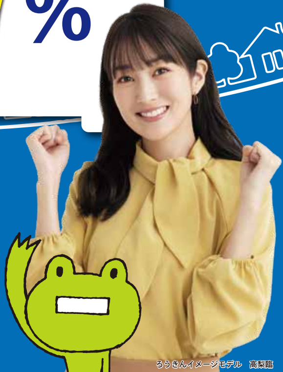
ろうきんイメージモデル 高梨臨

◎キャンペーン金利は「変動金利型」かつ「(一社)日本労働者信用基金協会保証」によるお申込み、かつ2022年3月31日までに受付し、2022年4月30日までにお借入(ご契約)した場合、適用となります。「固定金利型」やその他の保証会社でのお申込みはキャンペーン金利が適用されませんのでご注意ください。キャンペーン金利以外の借入条件(金利等)は、ホームページまたは九州ろうきん店頭でご確認ください。◎キャンペーン期間中に表示金利が変更される場合もございます。◎ご融資金額は所属される会員等により異なる場合がございます。◎変動金利型は年2回適用金利を見直しします。◎お借入後に返済方法(返済額・返済期間など)を変更される場合には、手数料(税込5,500円)がかかります。変更内容によっては、ご希望に添えない場合もございます。◎お借入予定資金に九州ろうきんで現在ご利用中のローンの借り換えが含まれる場合は条件がございます。◎ご返済額の試算はお気軽に(ろうきん)まで。パソコンやスマートフォンから九州ろうきんホームページの「ローンシミュレーション」もご利用いただけます。◎記載内容は、2021年7月1日現在の内容で、保証先を(一社)日本労働者信用基金協会とする場合です。◎金利引下げには、カードローンのご契約等、取引条件がございます。◎くわしくは、九州ろうきんホームページまたは店頭の商品概要説明書でご確認ください。◎融資には審査がございます。審査の結果、ご希望に添えない場合もございますので、あらかじめご了承ください。