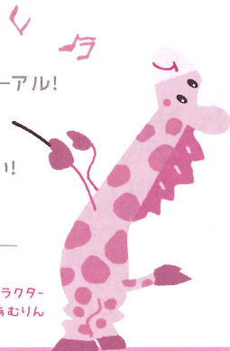
イメージキャラクター あむりん

教職員の皆さまを取りまく 社会情勢の変化に対応しリニューアル! 長〜く安心してご利用いただける トリプルガードをぜひご利用ください!