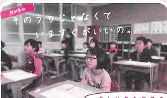
北っ子漢字大会 リーダース